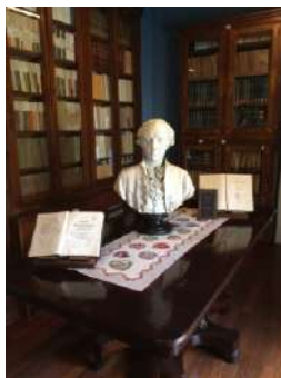
Sala 2 nell'ammezzato

La ricomposizione della Biblioteca ha dato nuova vita ai libri, alle collane e alle raccolte di periodici, al fondo antico, ai Fondi Russo, Guglielmino, Gravagna, La Greca. L'amore per i libri e la cultura ha fatto vincere la sfida ritenuta ardua. Una massa complessiva di oltre 12.000 pezzi è stata ricollocata in antiche vetrine (#119). Il successivo passo sarà verso la completa fruizione della Biblioteca, già inserita nell'Anagrafe delle Biblioteche italiane, verso il riordinamento del Catalogo. Di un nuovo inventario e nell'adozione del servizio SNB.