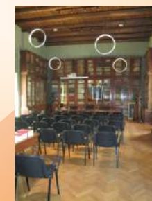
Il salone principale