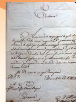
Il permesso per la fondazione dell'Accademia Gioenia: 1823

Una biblioteca è una fabbrica in veloce espansione, possiede un'energia interna che ha bisogno di sovvenzioni presenti e future per essere governata e infine possedere un'anima.