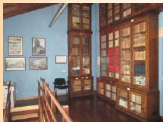
Sala 1 nell'ammezzato

Pubblicazioni: Atti Accademia Gioenia (1825 - 2002), Giornale del Gabinetto letterario (1834 - 1868), Bollettino Accademia (1888 - 2022, dal 2020 on line con i.f.).