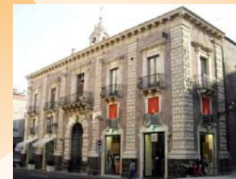
Palazzotto Biscari, via Etnea 29